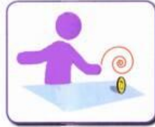
Likes to spin objects