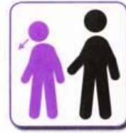
No eye contact