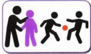
Joins in only if adult insists and assists