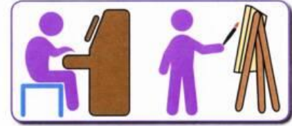
Can do some things very well, very quickly but not tasks involving social understanding