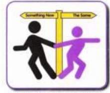
Variety is not the spice of life