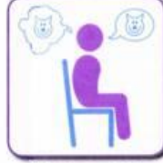
Talks incessantly about only one topic