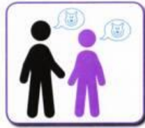
Echolalic, copies words like a parrot