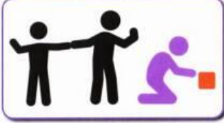
Does not play with other children