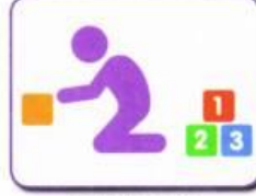
Lack of creative pretend play