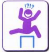
Inappropriate laughing or giggling