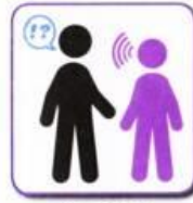
One sided interaction