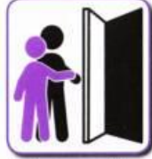
Indicates needs by using an adult's hand