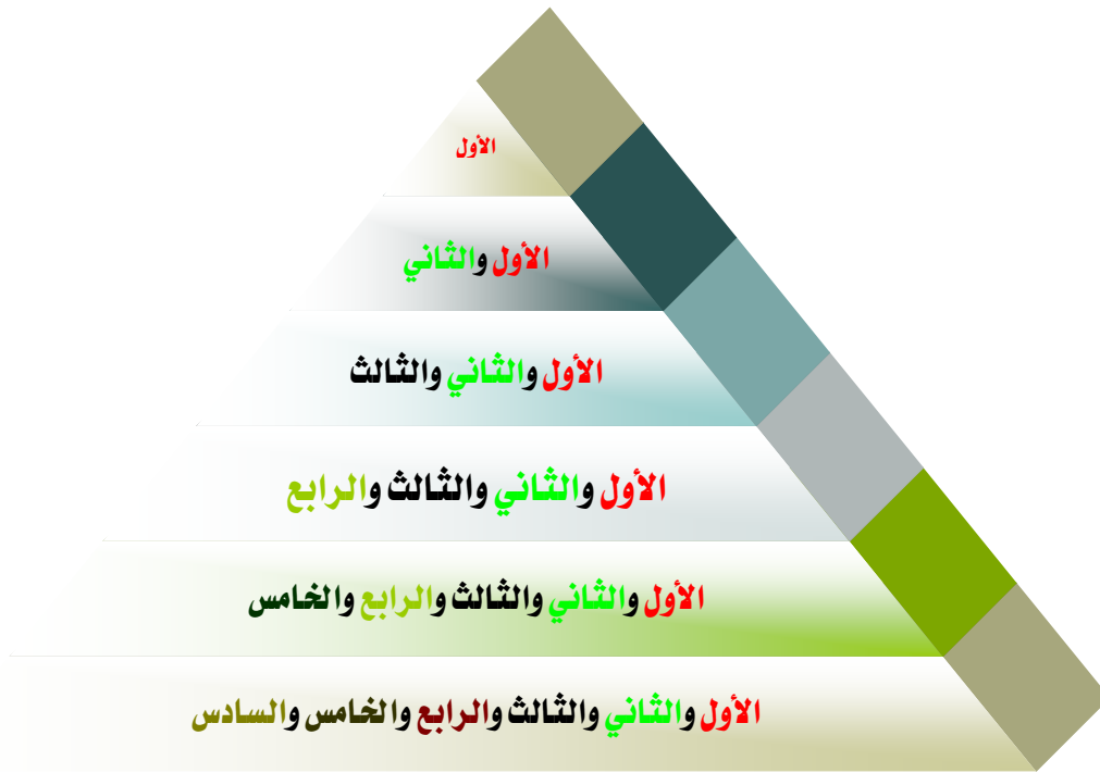
شكل رقم (١) هرم صيانة الأهداف القصيرة المدى

تطبيقها بفعالية كافية بإذن الله لتعميم المهارة )